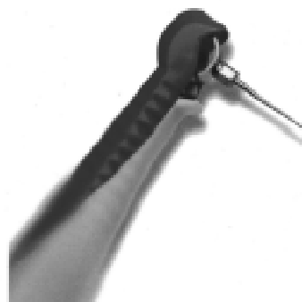
Наконечник с права пародонтална сонда